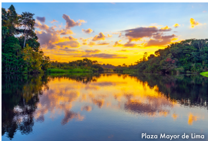
Plaza Mayor de Lima

Desayuno en el hotel. El día esperado para conocer una de las 7 Maravillas del Mundo. Embarque en la estación de Ollantaytambo. Salida en tren seleccionado. Arribo a la estación de Machu Picchu. Asistencia de nuestro personal para abordar el bus que ascenderá por un camino sinuoso, con una espectacular vista del río Urubamba y da forma a un profundo cañón. La Ciudad Perdida de los Incas, Machu Picchu, nos recibirá con sus increíbles terrazas, escalinatas,