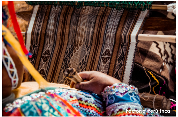
Factoría Perú Inca

recintos ceremoniales y áreas urbanas. La energía emana de todo el lugar. Almuerzo. A la hora coordinada, retorno en tren y trasladado al hotel en Cusco. Alojamiento.