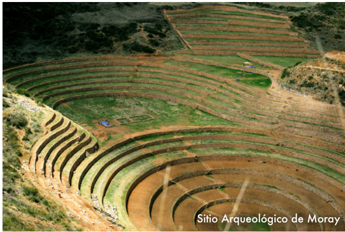
Sitio Arqueológico de Moray