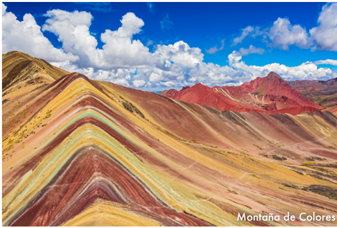
Montaña de Colores