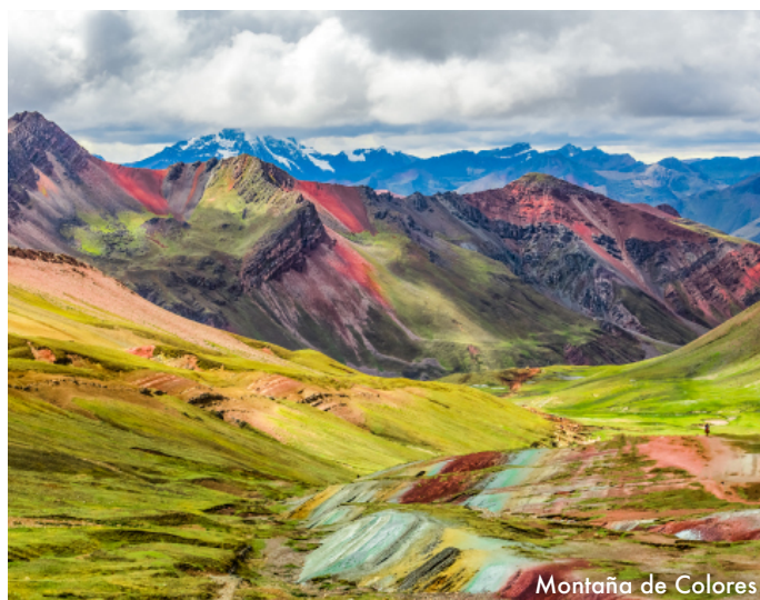
Montaña de Colores

Desayuno en el hotel. El día esperado para conocer una de las 7 Maravillas del Mundo. Embarque en la estación de Ollantaytambo. Salida en tren seleccionado. Arriba a la estación de Machu Picchu. Asistencia de nuestro personal para abordar el bus que ascenderá por un camino sinuoso, con una espectacular vista del río Urubamba y da forma a un profundo cañón. La Ciudad Perdida de los Incas, Machu Picchu, nos recibirá con sus increíbles terrazas, escalinatas, recintos ceremoniales y áreas urbanas. La energía emana de todo el lugar. Almuerzo. A la hora indicada, retorno en tren y trasladado al hotel en Cusco. Alojamiento.