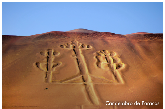
Candelabro de Paracas

Desayuno en el hotel. Salida en bus con destino a la bahía de Paracas. Llegada y asistencia para abordar las modernas avionetas de Aerodiana, Cessna Grand Caravan en el aeropuerto de Pisco. Sobrevolará las arenas del desierto de Ica antes de llegar a la gran pampa de Nasca, donde se encuentran los misteriosos y enigmáticos diseños y líneas perfectas que cruzan esta enorme extensión de tierra. Los diseños sólo pueden ser apreciados desde el aire, y es lo que motiva tantas teorías y misterios sobre su función y para quienes fue realizado. Los diseños más conocidos son los del mono, el colibrí, la araña, el lagarto, el astronauta, el perro, el cóndor y mu-