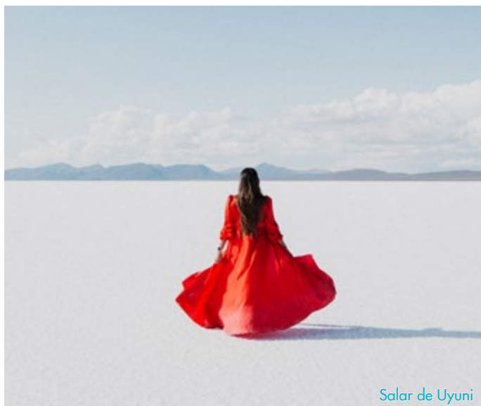
Salar de Uyuni

IMPORTANTE: • El orden de las visitas de las ciudades puede ser modificado en función de la disponibilidad de los servicios terrestres y aéreos respetándose en todo momento la realización de todas las visitas y excursiones programadas en el itinerario. • Precios informativos, sujetos a modificaciones sin previo aviso. Favor de confirmar el precio final al realizar su reserva.